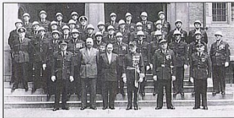
Het politiekorps van Turnhout op de binnenkoer van het kasteel, 1951, Historisch F. Muissen

We doen een greep uit de rijke inhoud. Het eerste deel, 'Beleid en Beheer', bestaat uit de vele banden briefwisseling die bij de politie zijn binnengekomen en uitgegaan en ook de brieven ter kennisgeving aan de manschappen en dagorders aan het hele corps en de officieren. Hier komt ook het personeel aan bod, met onder andere registers van wachtdiensten en registers ter controle van de aanwezigheid van de manschappen op verschillende plaatsen in de stad. Ook de aanwerving, benoeming en uitbetaling van het personeel zijn gedocumenteerd.