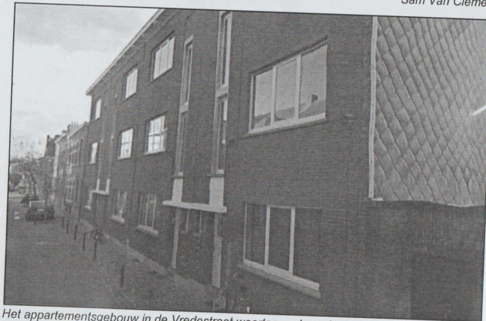
Het appartementsgebouw in de Vredestraat waartegen de gedenksteen werd aangebracht.