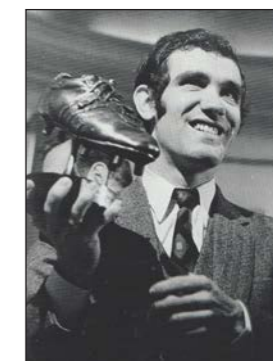
▲ Wilfried Van Moer met een van zijn drie Gouden Schoenen.