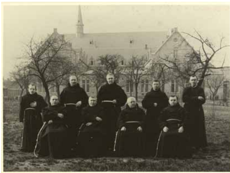
De eerste Minderbroeders van het herstichte klooster te Turnhout