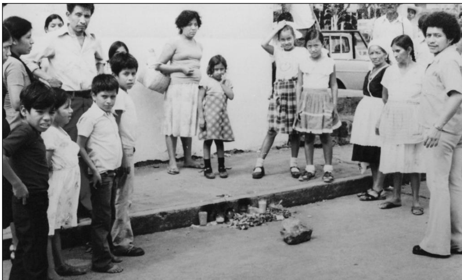
De plaats van de moord

tie per brief weten dat 'men besluit dat de genoemde geestelijke het slachtoffer was van een subversieve daad, die ze tot op heden niet konden identificeren, desondanks gaat het onderzoek verder' .