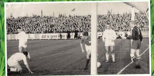
Swat Persegaet scoort voor KFCFT in de met 1-3 verloren wedstrijd tegen toekomstig kampioen Anderlecht.