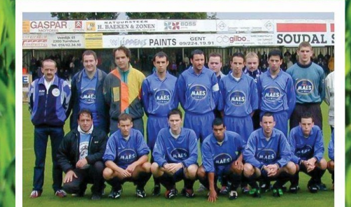
In het seizoen 2000-2001 ambeert KFCFT de overgang naar eerste klasse, maar belandt licentieloos in de derde afdeling.