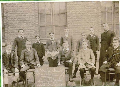
Een van de eerste Turnhoutse voetbalploegen ontstond op de speelplaats van het Sint-Victorinstituut. De foto dateert uit 1909-1910.