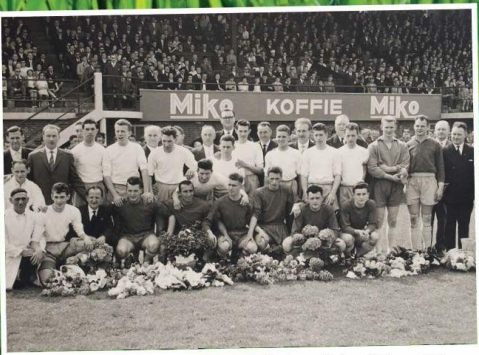
Huldiging in een volgelopen Villapark van de ploeg die in 1960 kampioen speelde in derde klasse.